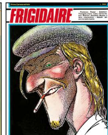
Frigidaire n.11, immagine di Andrea Pazienza