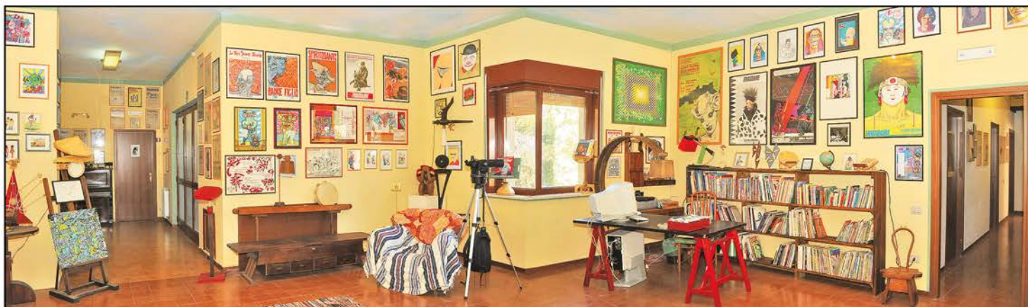
Il salone principale del MAM, Museo/Laboratorio dell'Arte Maivista