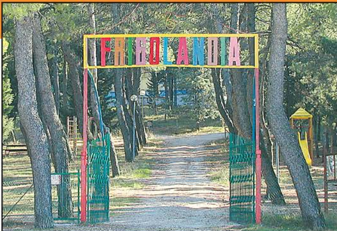
Il cancello in ferro dipinto di Pasquale Cardillo e il viale nel parco