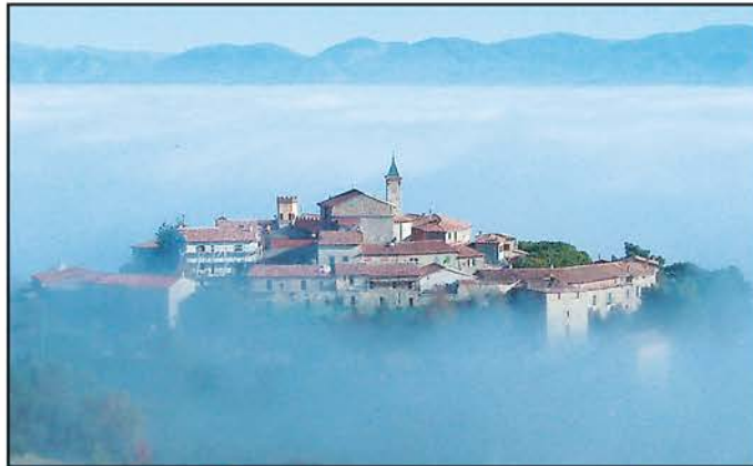
Il borgo medievale di Giano dell'Umbria visto dalle finestre di Frigolandia

Repubblica della fantasia Accademia delle invenzioni Parco della pace e della musica Villaggio nomade della poesia Ashram socratico Monastero eurotibetano Città immaginaria dell'Arte Maivista Prima Repubblica Marinara di Montagna