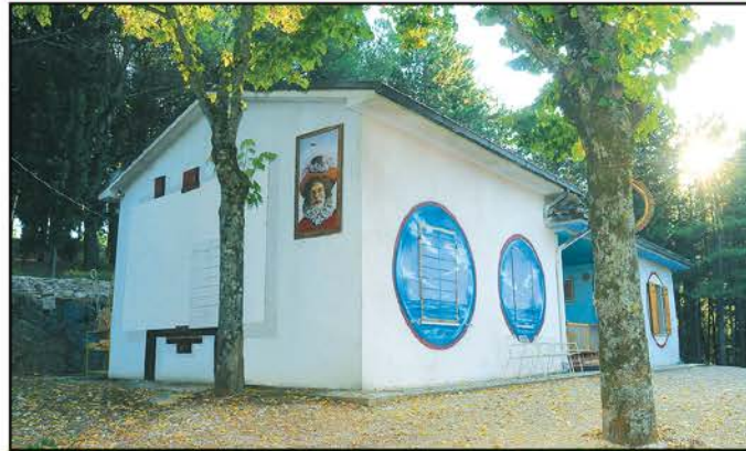
La Casa degli Oblò, per tutti i cittadini ospiti di Frigolandia

DIVENTA CITTADINO/A DI FRIGOLANDIA! CON 100 EURO AVRAI IL PASSAPORTO* E UNA SETTIMANA DI ALLOGGIO GRATUITO NELLA TUA/NOSTRA REPUBBLICA DELL'ARTE