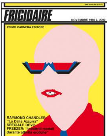
Frigidaire n.1, immagine di Stefano Tamburini