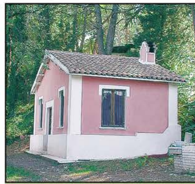
La Casa Rosada, per coppie o famiglie

DIVENTA CITTADINO/A DI FRIGOLANDIA! CON 100 EURO AVRAI IL PASSAPORTO* E UNA SETTIMANA DI ALLOGGIO GRATUITO NELLA TUA/NOSTRA REPUBBLICA DELL'ARTE