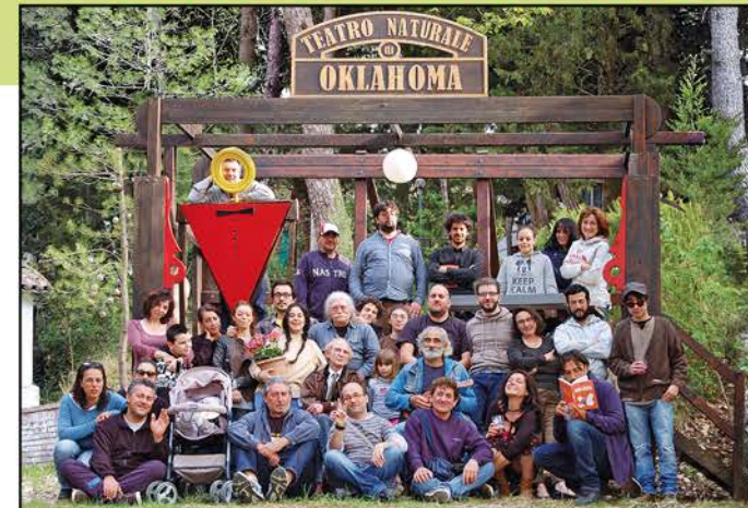
Cittadini frigolandesi nel Teatro Naturale di Oklahoma di Luciano Biscarini