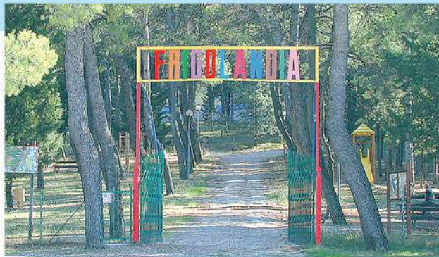
Il cancello d'ingresso di Frigolandia

Frigolandia , letteralmente la terra della rivista Frigidaire , è uno spazio artistico concettualmente sconfinato, ma anche un luogo concreto ben definito. È il sogno, divenuto realtà nel 2006, di una repubblica della fantasia e della creatività, di una città immaginaria dell'Arte Maivista. Caratteristica essenziale di questo singolare progetto è la collocazione di un moderno centro di produzione artistica di tipo metropolitano e cosmopolita, in un territorio agricolo come quello del Comune di Giano dell'Umbria, meraviglioso borgo medioevale in pietra viva, sulla strada dei Monti Martani, poco lontano da Assisi, nel cuore del fantastico triangolo d'oro Todi-Foligno-Spoleto.