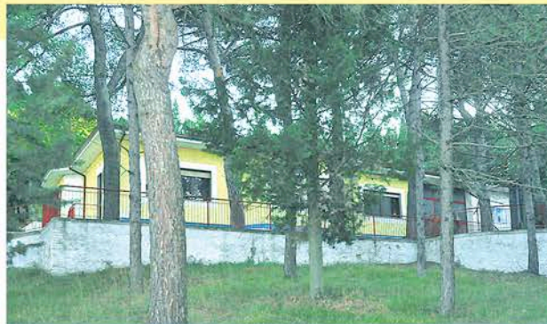
Una veduta dell'edificio principale

La Repubblica di Frigolandia , oltre che una comunità ideale e un centro d'accoglienza temporaneo per i suoi cittadini immaginari, è anche il Museo/Laboratorio dell'Arte Maivista, il movimento serio e parodistico, postavanguardista e perciò sempre all'avanguardia, inventato nel 1985 da Vincenzo Sparagna e Andrea Pazienza e promosso dalle nostre riviste: Frigidaire , Cannibale , Il Male , Frizzer , Vomito , Tempi Supplementari , Il Lunedì della Repubblica , La Piccola Unità , Il Nuovo Male .