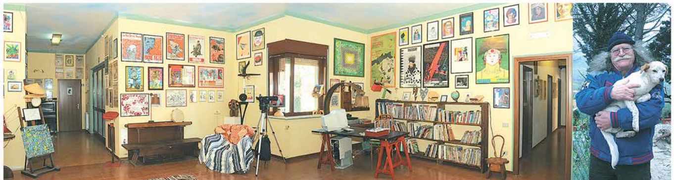
Il salone della Galleria/Museo dell'Arte Maivista.