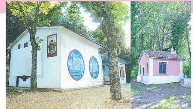
La Casa degli Oblò