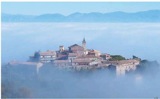
Il borgo di Giano dell'Umbria visto dalle finestre di Frigolandia

Repubblica della fantasia Accademia delle invenzioni Parco della pace e della musica Villaggio nomade della poesia Ashram socratico Monastero eurotibetano Città immaginaria dell'Arte Maivista Prima Repubblica Marinara di Montagna